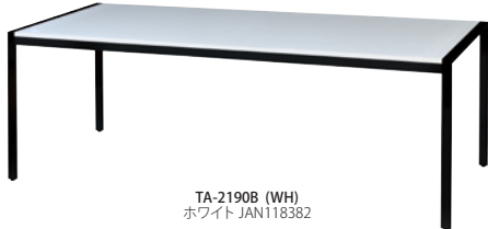
TA-2190B(WH) ホワイト JAN118382