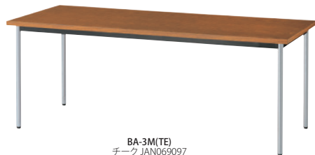
BA-3M(TE) チーク JAN069097