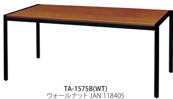
TA-1575B(WT) ウォールナット JAN 118405