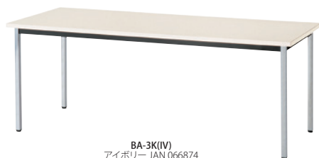
BA-3K(IV) アイボリー JAN 066874